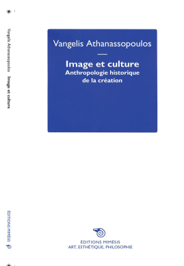
Image et culture. Anthropologie historique de la création , Σέστο Σαν Τζιοβάννι, Mimésis, Σειρά «Art, Esthétique, Philosophie», 2021 (124 σελίδες).

La publicité dans l'art contemporain I. Esthétique et postmodernisme , Παρίσι, L'Harmattan, Σειρά «Esthétique», 2009 (τμήμα της διδακτορικής διατριβής, 208 σελίδες, 28 εικόνες).